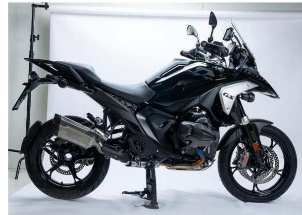
BMW R 1300 GS - Euro 5 2023 →